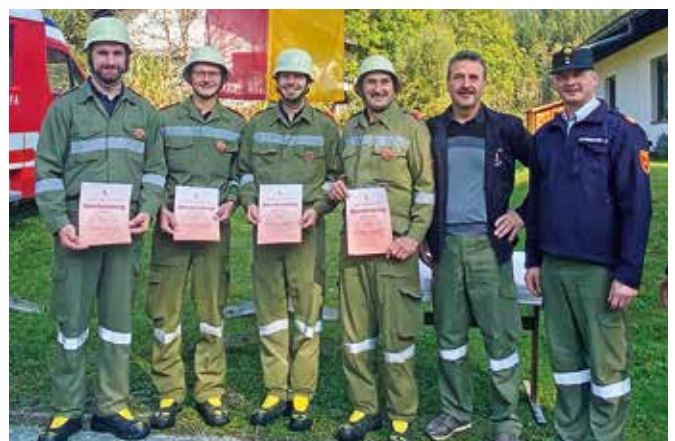
Technische Leistungsprüfung in Radnig