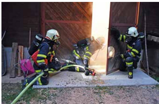
Übung vlg. Pritschon