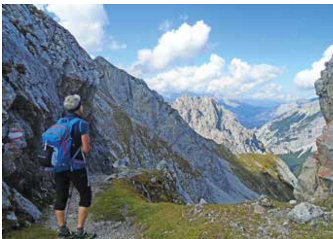
Goetheweg – Innsbrucker Nordkette