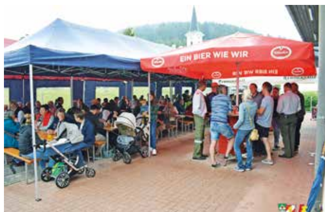
Tag der offenen Tür

Der Feuerwehrausflug führte uns im Herbst 2023 in das steirische Vulkanland. Auf der Fahrt dorthin besichtigten wir die Zotter-Schokolademanufaktur in Riegersburg, danach ging es weiter zur Ursprung-Tour in der Vulcano Schin-