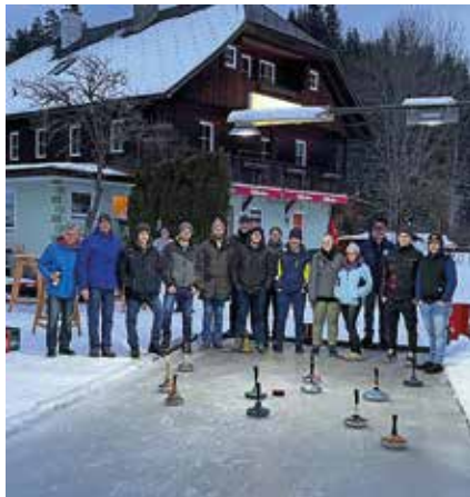
Neujahrstreff Gasthof Weißbacher

Am Faschingssamstag, dem 10. Februar 2024 fand traditionell wieder unser Feuerwehrball statt. Bei Musik von den „jungen fidelen Lavanttalern“ wurde ausgeliebig getanzt und gefeiert. Um Mitternacht wurden unter den Ballbesuchern wertvolle Sachpreise und eine Kutschenfahrt als Hauptpreis verlost. Wir dürfen uns bei dieser Gelegenheit bei den zahl-